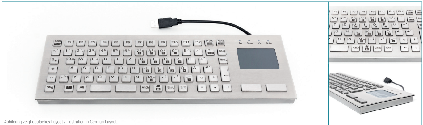
Abbildung zeigt deutsches Layout / Illustration in German Layout